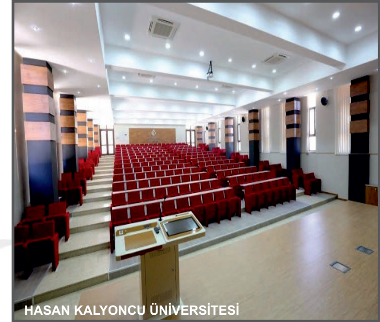
HASAN KALYONCU ÜNİVERSİTESİ