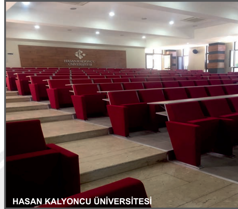
HASAN KALYONCU ÜNİVERSİTESİ