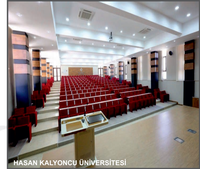
HASAN KALYONCU ÜNİVERSİTESİ