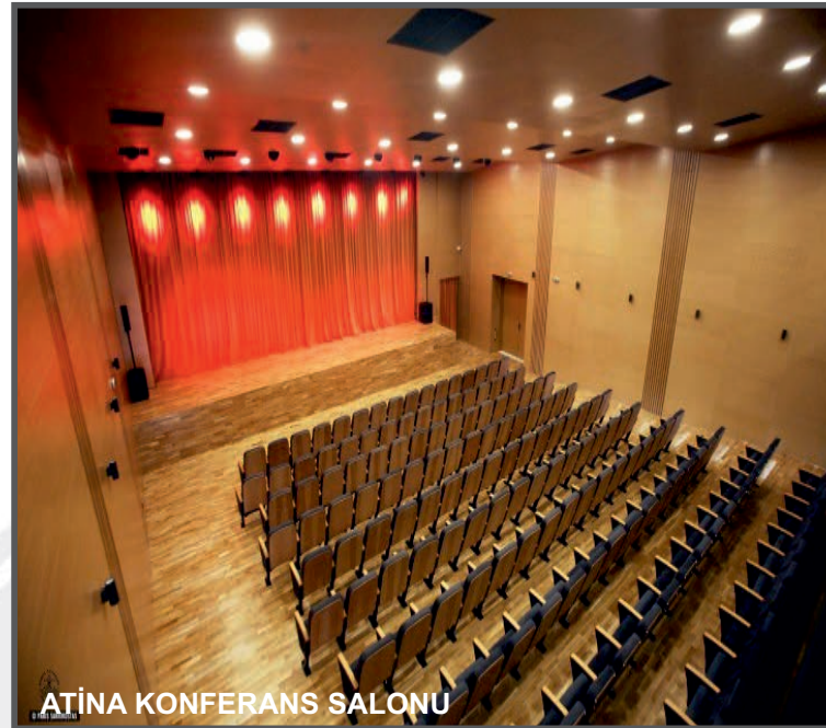
ATINA KONFERANS SALONU