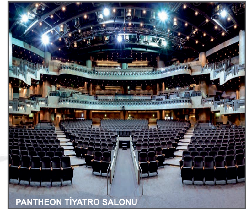
PANTHEON TİYATRO SALONU