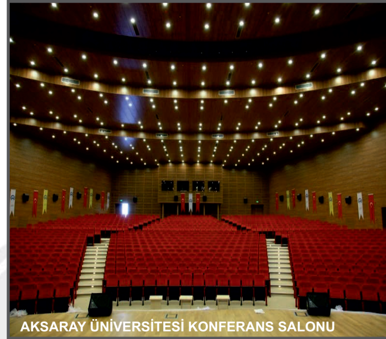
AKSARAY ÜNİVERSİTESİ KONFERANS SALONU