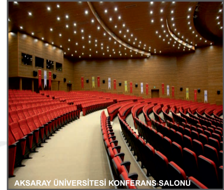
AKSARAY ÜNİVERSİTESİ KONFERANS SALONU